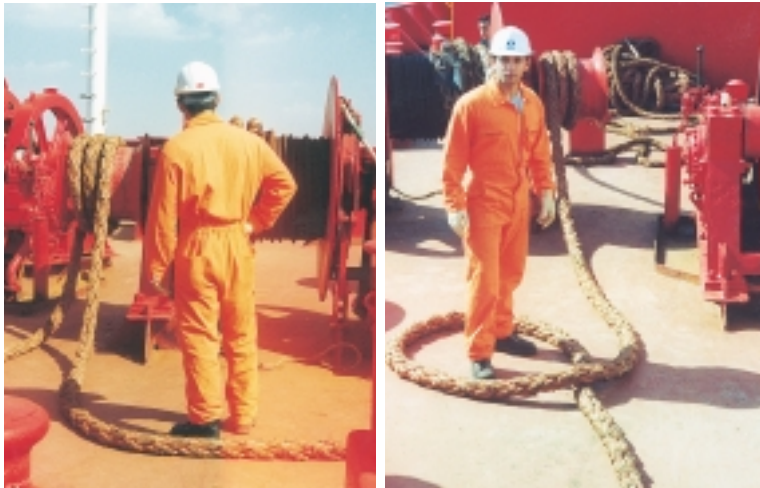
Εικόνα 4.12 (δ), (ε): Ο ναυτικός δεν πρέπει να αφαιρείται όταν συμμετέχει σε εργασίες πρόδρασης του πλοίου. Πάντοτε πρέπει να βρίσκεται σε θέση «νέτα» από τους κάβους που βιράρονται ή πρόκειται να βιραριστούν.