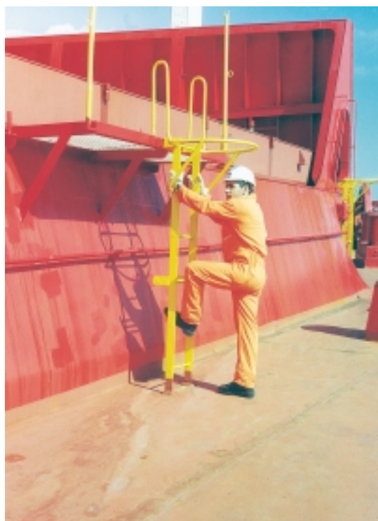
Εικόνα 4.9 (α): Προστατευτικός εξοπλισμός του εργαζομένου ναυτικού (φόρμα, κράνος, γάντια, γερά παπούτσια κτλ.)