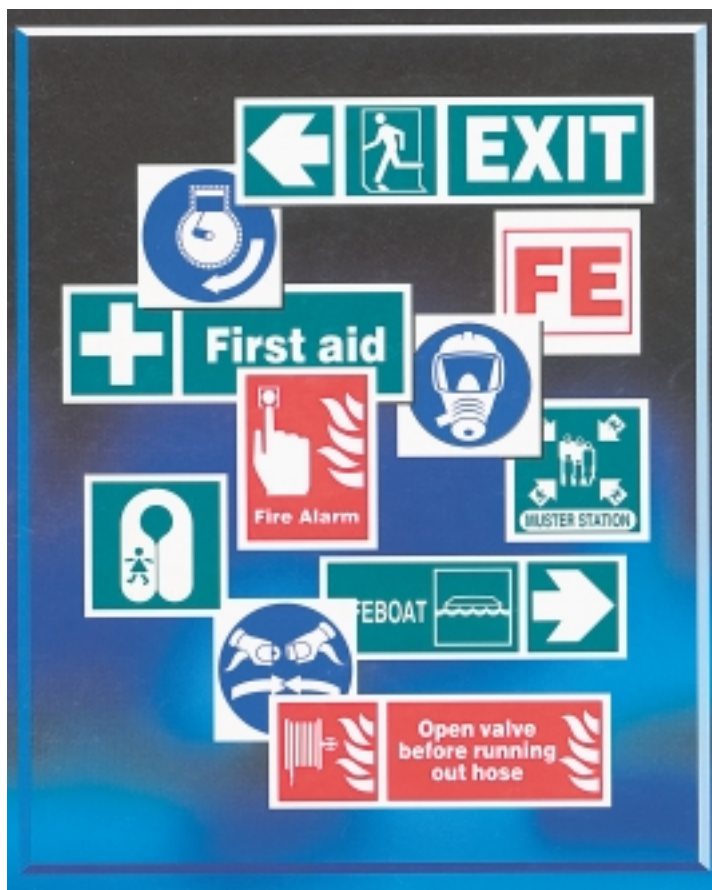
Εικόνα 4.7: Φαίνονται, ενδεικτικά, μερικά από τα σήματα ασφαλείας που χρησιμοποιούνται στα πλοία.

φεύγονται ζημιές στο πλοίο και το φορτίο και κυρίως να αποφεύγονται ανθρώπινα ατυχήματα.