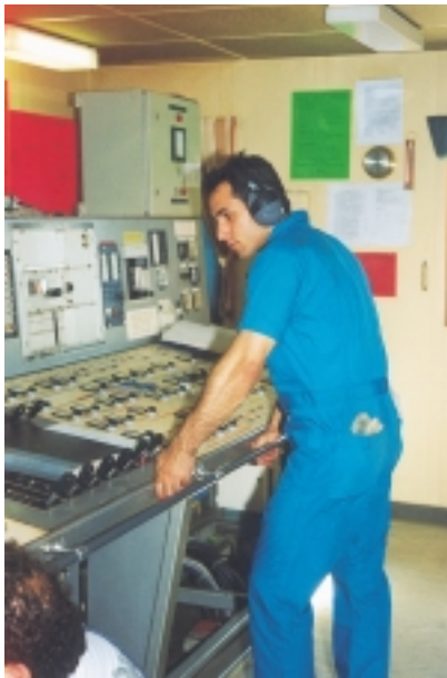
Εικόνα 4.13 (α): Προστασία της ακοής από το θόρυβο των μηχανών