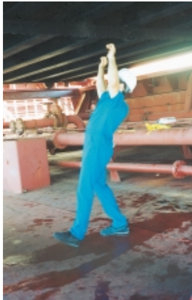
Εικόνα 4.13 (β): Όταν χύνονται λάδια στο πανιόλο ή στο κατάστρωμα, πρέπει να απομακρύνονται άμεσα, διότι μπορεί κάποιος να γλιστρήσει επικίνδυνα.

ουργούν κινδύνους είτε στους απασχολούμενους με αυτές, είτε στη διαδικασία της φορτοεκφόρτωσης (εικ. 4.12.β, γ).