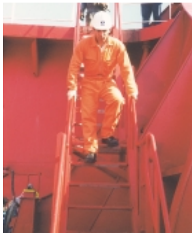
Εικόνα 4.12 (γ): Σωστός τρόπος για το κατέβασμα ή το ανέβασμα μιας σκάλας.