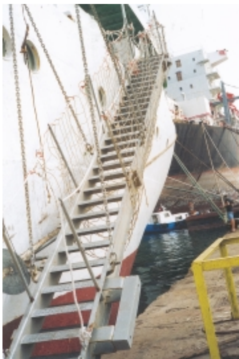
Εικόνα 4.1: Σκάλα επιβίβασης (Γκάνγκουες) με δίχτυ ασφαλείας

Οι κύριες σκάλες επιβίβασης και αποβίβασης είναι (πρέπει να είναι) έτσι κατασκευασμένες και προσαρμοσμένες στο σκάφος, ώστε να μπορούν να ρυθμίζονται και να προσαρμόζονται στις κινήσεις του πλοίου, όπως π.χ. οι κινήσεις που προκαλούνται από τις διακυμάνσεις της παλίρροιας (μαρέα) ή οι παλινδρομήσεις του πλοίου πλώρα – πρύμα κατά μήκος του προβλήτα, από διάφορες αιτίες, (π.χ. από «ρεστία») (εικ. 4.1).