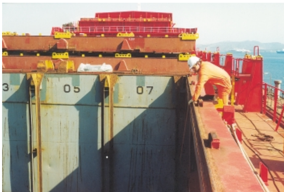
Εικόνα 4.3: Λανθασμένος και επικίνδυνος τρόπος να «επιθεωρούμε» ένα αμπάρι από το χείλος του κουβουσιού. Το σωστό είναι, το κέντρο βάρους του σώματος να παραμένει αισθητά έξω και κάτω από το χείλος του κουβουσιού και μόνο το κεφάλι να περνάει μέσα από αυτό.

Για την είσοδο του προσωπικού στα αμπάρια του πλοίου πρέπει να χρησιμοποιούνται αποκλειστικά οι ειδικές σκάλες που υπάρχουν σε συγκεκριμένες θέσεις – καθόδους του αμπαριού. Δεν πρέπει να χρησιμοποιούνται ανεμόσκαλες ή άλλα επισφαλή μέσα, κυρίως μάλιστα όταν το αμπάρι είναι άδειο (εικ. 4.3).