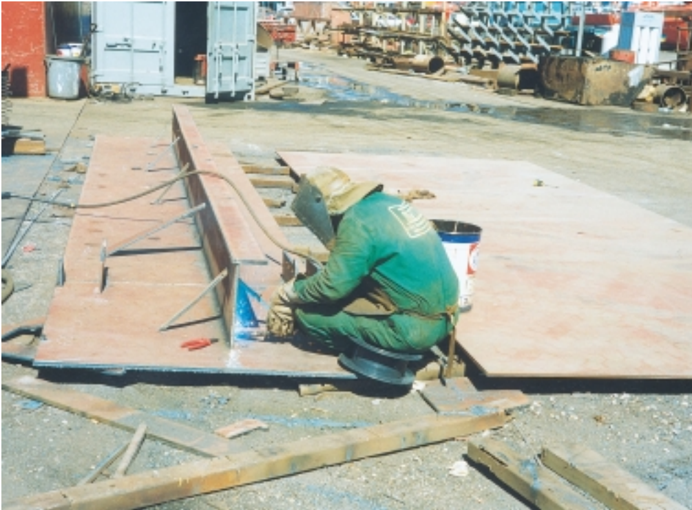
Εικόνα 4.9 (γ): Κατά την ηλεκτροκόλληση και οξυγονοκοπή μετάλλων, για τη σωστή προστασία των ματιών και του προσώπου, πρέπει να χρησιμοποιείται προστατευτική προσωπίδα.