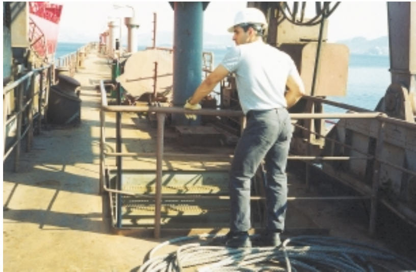
Εικόνα 4.4: Όπου υπάρχουν βαθιά ανοίγματα, πρέπει να περιφράζονται με προστατευτικά κιγκλιδώματα.

Αυτά, πρέπει να έχουν ύψος τουλάχιστο ενός μέτρου και μπορεί να φτιάχνονται με γερούς στάντηδες (πασσάλους) και με σύρματα ή αλυσίδες που θα περνούν και θα σταθεροποιούνται πάνω σ' αυτούς. Ένα ενδιάμεσο ρέλι (σύρμα ή αλυσίδα) πρέπει να τοποθετείται μισό μέτρο χαμηλότερα από το πάνω ρέλι. Τα σύρματα και οι αλυσίδες πρέπει να