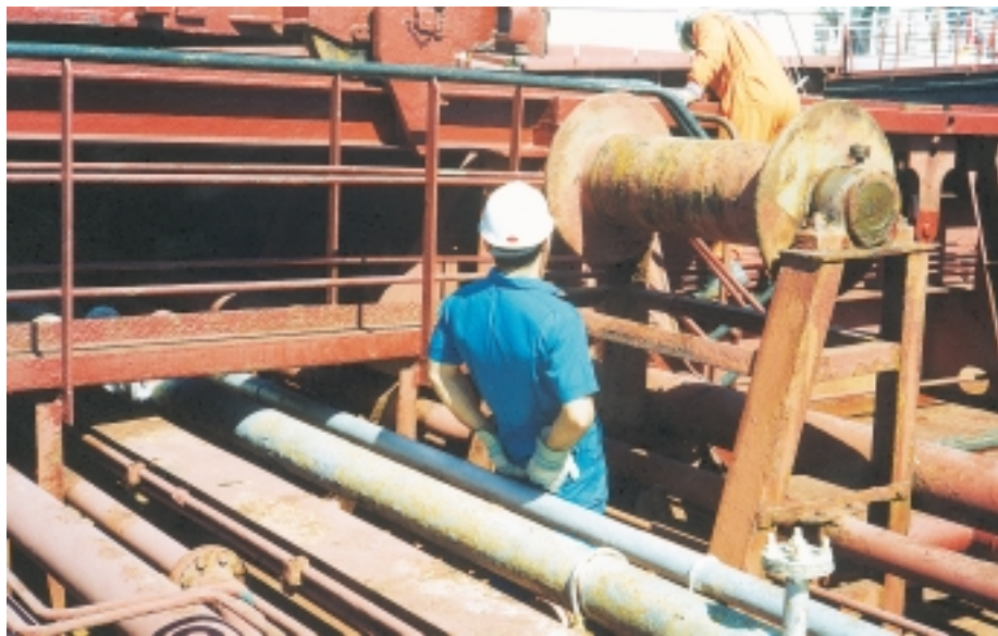
Εικόνα 4.6: Ο ναυτικός δεν πρέπει να ακουμπάει σε σωλήνες μέσα από τις οποίες περνάει καυτό υλικό, όπως π.χ. ατμός.

Οι πιο επικίνδυνες σωληνώσεις που υπάρχουν σε ένα πλοίο, είναι αυτές μέσα από τις οποίες περνάει καυτό υλικό, όπως είναι ο ατμός και τα καυσαέρια μηχανών (εικ. 4.6).