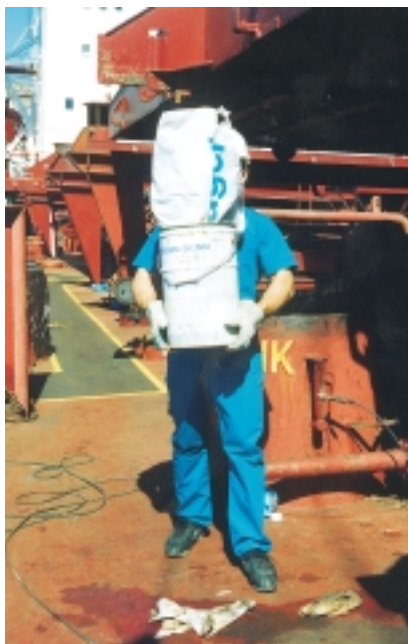
Εικόνα 4.11 (β): Όταν κάποιος μεταφέρει κάποια αντικείμενα πρέπει να βλέπει καλά μπροστά του, για να αποφεύγει τυχόν εμπόδια πάνω στα οποία θα μπορούσε να σκοντάψει επικίνδυνα.

στή, θα πρέπει να σιγουρεύεται ότι το βάρος, που πρόκειται να σηκωθεί και να μεταφερθεί, έχει κρεμαστεί σωστά και ότι κανένας άνθρωπος δεν βρίσκεται πάνω του ή κοντά του ή ότι εκτίθεται σε κίνδυνο.