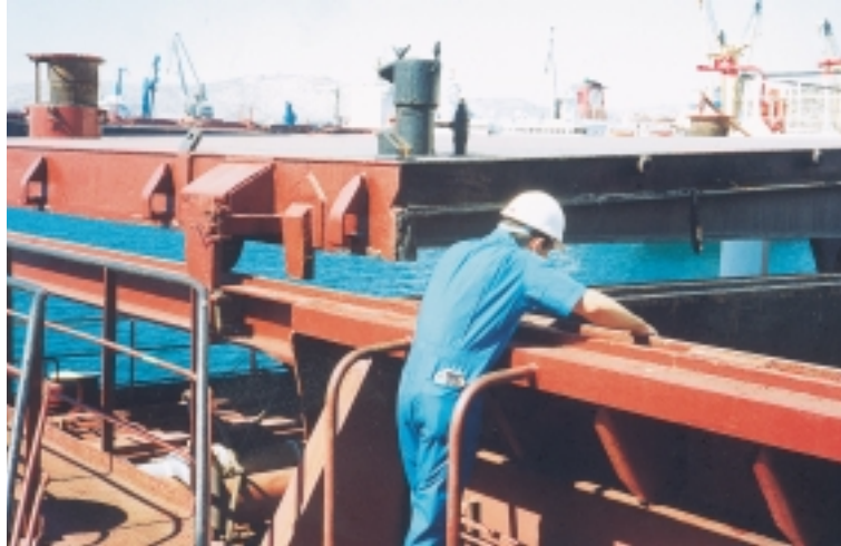
Εικόνα 4.2: Όταν μετακινούνται τα καπάκια των αμπαριών, ο ναυτικός πρέπει να τα παρακολουθεί από ασφαλή θέση (και όχι όπως ο ναυτικός της εικόνας)

Σε όλα τα σημεία ή περιοχές όπου πρόκειται να εργαστεί ή να περάσει το προσωπικό, πρέπει να υπάρχει επαρκής φωτισμός.