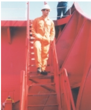
Εικόνα 4.12 (β): Λανθασμένος τρόπος για το κατέβασμα ή το ανέβασμα μιας σκάλας.

Στους χώρους όπου γίνονται εργασίες φορτοεκφόρτωσης, δεν πρέπει να εκτελούνται κανενός άλλου είδους εργασίες, όπως συντήρηση ή επισκευή (ματσακόνισμα, βάψιμο, ηλεκτροσυγκόλληση, μηχανικές επισκευές κτλ.), αν αυτές δημι-