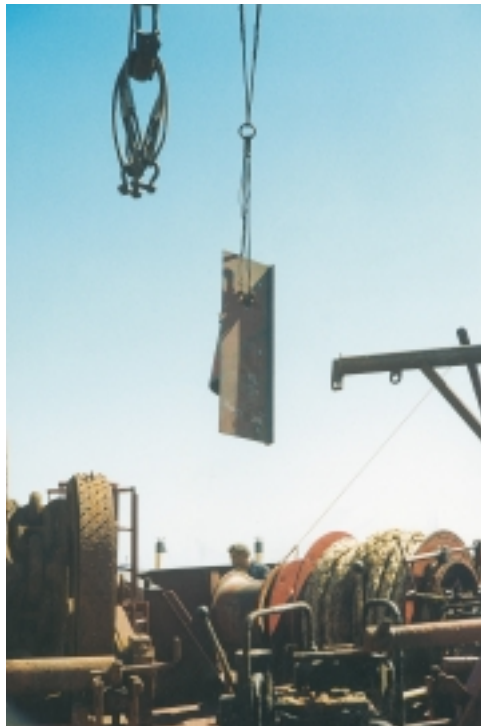
Εικόνα 4.11 (α): Ποτέ κανείς δεν πρέπει να περνάει κάτω από ένα βάρος που σηκώνει ένας γερανός ή μία μπίγα

Όταν χρησιμοποιούνται τα ανυψωτικά μέσα του πλοίου για το σήκωμα κάποιων βαρών, πρέπει να παίρνονται από το πλήρωμα κάποια μέτρα προστασίας, για να αποφευχθεί κάποιο ανεπιθύμητο ατύχημα στους ίδιους ή σε διερχόμενους συναδέλφους τους.