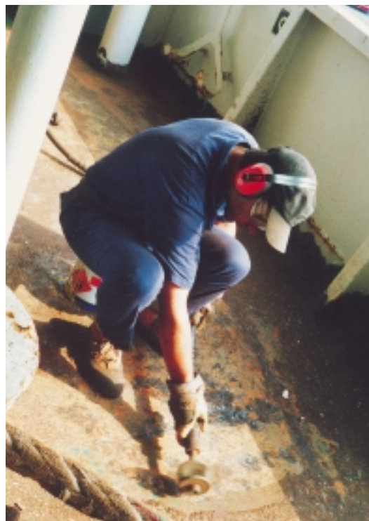
Εικόνα 4.9 (β): Κατά το ματσακόνισμα, ο ναυτικός πρέπει να προστατεύει τα μάτια του με ειδικά γυαλιά και ακουστικά για το θόρυβο, όταν χρησιμοποιεί μηχανικό ματσακόνι.