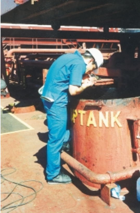
Εικόνα 4.8: Είναι πολύ επικίνδυνο το άναμμα τσιγάρου πάνω από το στόμιο τανκιού με πετρέλαιο ή κατάλοιπα πετρελαίου.

Όταν στο πλοίο χρειάζεται να γίνουν θερμογόνες εργασίες (οξυγονοκοπή ή ηλεκτροσυγκόλληση) πρέπει να παίρνονται όλα τα απαραίτητα προφυλακτικά μέτρα, τόσο για τη γυμνή φλόγα της «τσιμπίδας» όσο και για σπινθήρες ή πυρακτωμένα κομμάτια λειωμένου μετάλλου, για να μη προκληθεί πυρκαγιά σε γειτονικά εύφλεκτα υλικά.