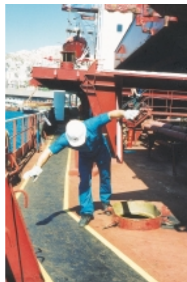
Εικόνα 4.12 (α): Προσοχή στα διάφορα εμπόδια κατά το περπάτημα.

Οι ναυτικοί που εργάζονται στο καταστρώμα πρέπει να προσέχουν, ώστε να αποφεύγουν εμπόδια πάνω στα οποία θα μπορούσαν να σκοντάψουν ή να χτυπήσουν, να προχωρούν με