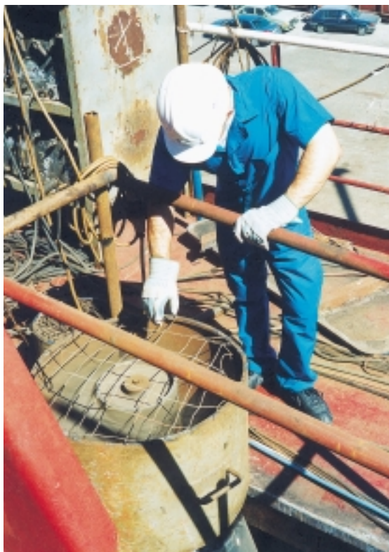
Εικόνα 4.5: Γύρω από ένα επικίνδυνο μηχάνημα που λειτουργεί, πρέπει να τοποθετείται προστατευτική περίφραξη, για την ασφάλεια όσων περνούν ή εργάζονται στην περιοχή.

Επίσης, για τον ίδιο λόγο, πρέπει να καλύπτονται με επαρκή μόνωση όλα τα εξαρτήματα των μηχανημάτων που θα μπορούσαν να αποτελέσουν κίνδυνο για το προσωπικό, όπως οι σωλήνες ατμού, οι εξατμίσεις μηχανών, οι εξαγωγές συμπιεστών. Παράλληλα, όπου κρίνεται σκόπιμο και απαραίτητο, να τοποθετούνται και προειδοποιητικές πινακίδες, οι οποίες να εφιστούν την προσοχή του προσωπικού.