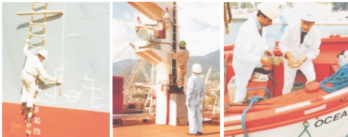
Εικόνα 4.10: Βασική ατομική προστασία όταν εκτελούνται διάφορες εργασίες καταστρώματος (φόρμα, κράνος, γάντια)

Ο εργαζόμενος κοντά σε μηχανήματα δεν πρέπει να χρησιμοποιεί στο λαιμό του κασκόλ, πανί για τον ιδρώτα ή άλλο επιπρόσθετο ύφασμα που μπορεί να κινηθεί εύκολα, γιατί υπάρχει ο κίνδυνος να πιαστεί στο μηχάνημα και να προξενήσει ατύχημα σ' αυτόν που το φοράει.