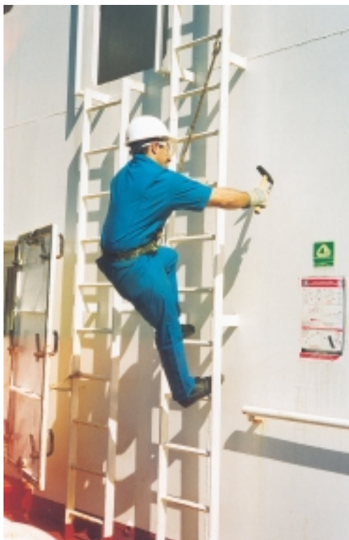
Εικόνα 4.14: Όταν ο ναυτικός εργάζεται σε «ψηλά» σημεία του πλοίου, πρέπει απαραίτητα, εκτός των άλλων, να φοράει και ζώνη ασφάλειας.

Τα άτομα που πρόκειται να εργασθούν ψηλά ή σε επικίνδυνα σημεία, πρέπει οπωσδήποτε να φορούν ζώνη ασφάλειας, η οποία θα είναι γερά δεμένη πάνω σε ένα σωσίβιο σχοινί (εικ. 4.14).